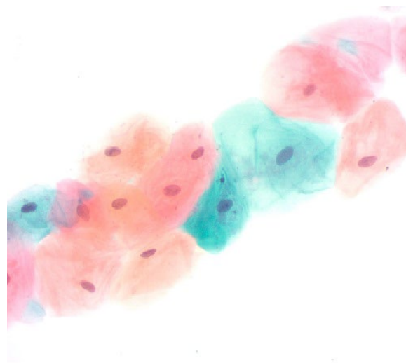
Oral squamous cells viewed at 40X stained with the Papanicolaou (PAP) Stain Kit.